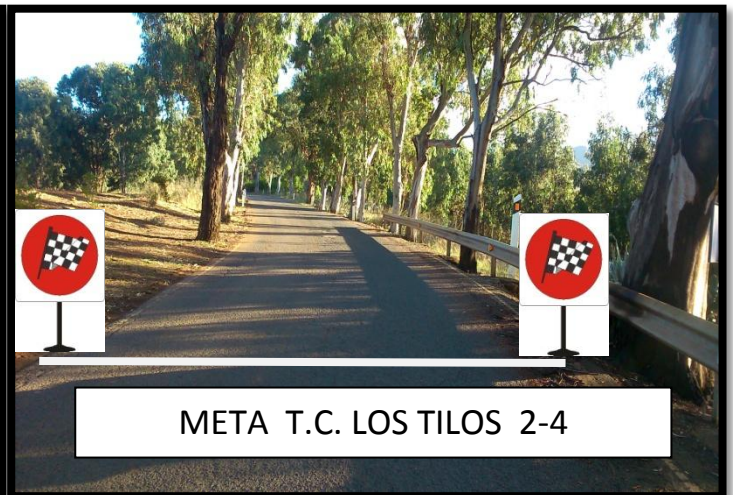
META T.C. LOS TILOS 2-4