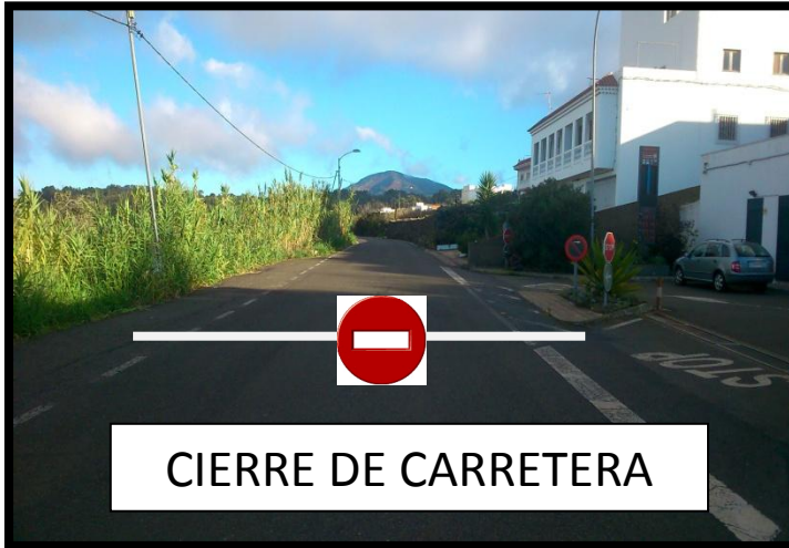
CIERRE DE CARRETERA