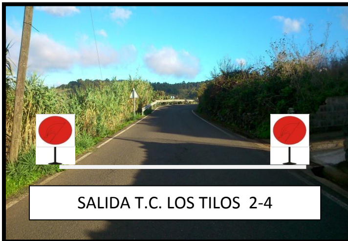
SALIDA T.C. LOS TILOS 2-4