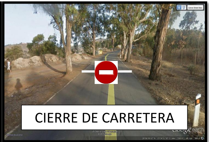
CIERRE DE CARRETERA

SALIDA: PASANDO 150m. aprox. GASOLINERA REPSOL EL PALMITAL P.K.5,20 GC-700